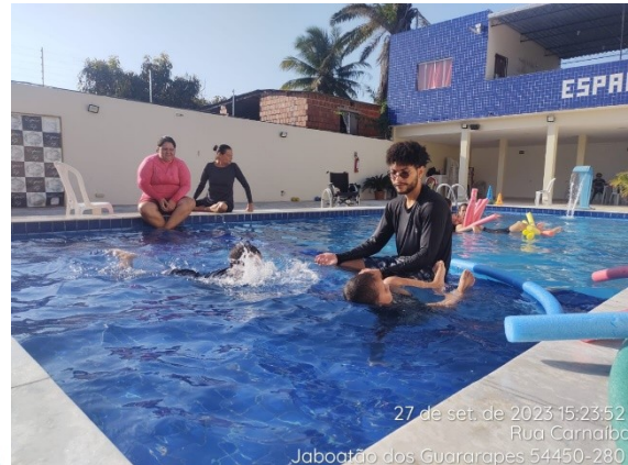
27 de set. de 2023 15:23:52 Rua Carnalba Jaboatão dos Guararapes 54450-280

Interação em grupo, usuários e cuidadores nas aulas de Natação