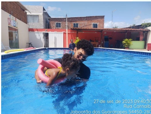
27 de set. de 2023 09:40:30 Rua Carnalba Jaboatão dos Guararapes 54450-280

CENTRO POLIESPORTIVO COMUNITÁRIO DE BARRA DE JANGADA - JABOATÃO - PE