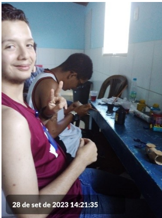
28 de set de 2023 14:21:35