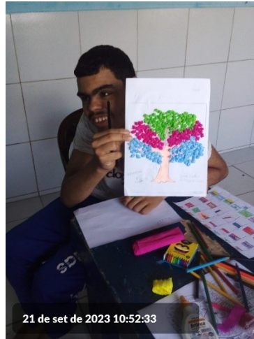
21 de set de 2023 10:52:33