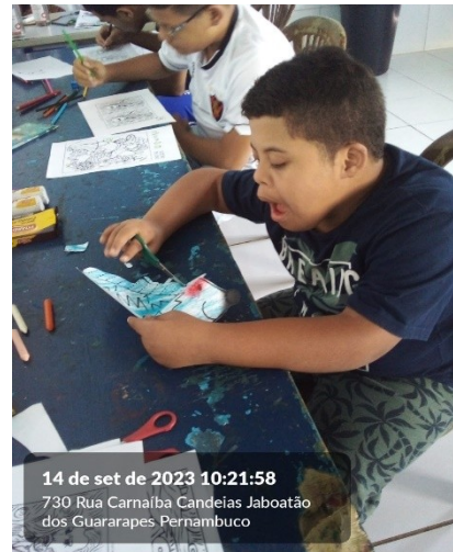
14 de set de 2023 10:21:58 730 Rua Carnalba Candeias Jaboatão dos Guararapes Pernambuco