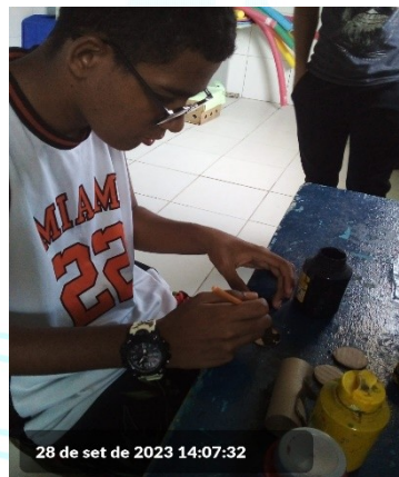
28 de set de 2023 14:07:32