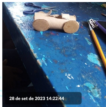
28 de set de 2023 14:22:44