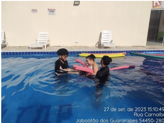
27 de set. de 2023 15:10:49 Rua Carnalba Jaboatão dos Guararapes 54450-280

Interação em grupo, usuários e cuidadores nas aulas de Natação