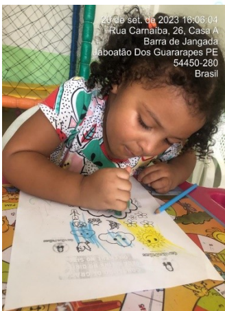
29 de set de 2023 16:06:04 Rua Carnalba, 26, Casa A Barra de Jangada Jaboatão Dos Guararapes PE 54450-280 Brasil